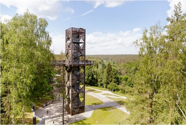
Medžių lajų takas.

7,54 m ilgio, 7,34 m pločio ir 5,7 m aukščio (iš jų – 1,5 m po žeme). Puntuko tūris – 100 m 3 . Puntuko tankis yra apie 2,7 g/cm 3 . Didžiausia horizontali apimtis – 21,39 m.